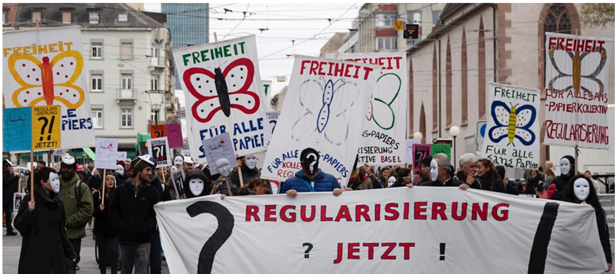
Abbildung 1: Demonstration der Sans-Papiers in Basel

Wie sehen die Sozialen Bewegungen der Sans-Papiers mit Fokus auf die Sans-Papiers-Kollektive in der Schweiz aus?