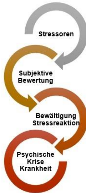
Abbildung 2: Stressgeschehen (In Anlehnung an: Kaluza 2011: 13)

oder verhindern gelingendes Coping (Bewältigung, Anpassung). Langfristiger Stress „führt zu subjektiver Beeinträchtigung des Wohlbefindens und zu objektiv messbaren Zeichen körperlicher und seelischer Krankheit oder zu Problemverhalten“ (Eppel 2007: 37).